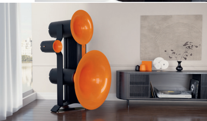
Der Trio G3 ist das Flaggschiff von Avantgarde Acoustic

Mit dem Colibri spricht Avantgarde Acoustic gezielt die jüngere Generation an – weg vom Kopfhörer zu einem ganzheitlichen Klangerlebnis